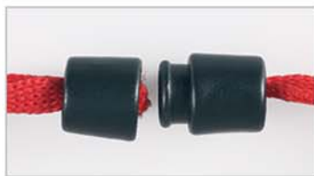
DISPOSITIVO SICUREZZA "SAFETY LOCK"